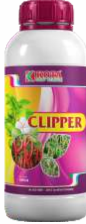
Pack Size 1000ml, 500ml, 250ml

पीक: मका, मिरची, कापूस, टोमॅटो, हरभरा, भुईमूग, भात, इतर भाजीपाला, आणि बागायती पिके.