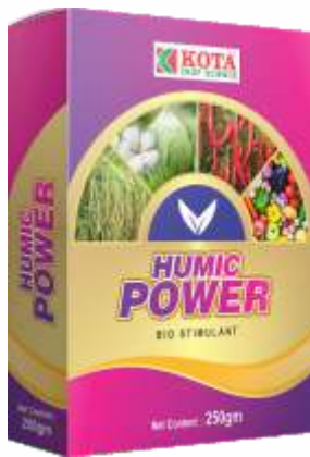
Pack Size 250gm, 100gm

Humic Power is a Eco Friendly, Naturally Derived Organic product for all crops.