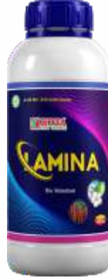
Pack Size 250 gm

खबरदारी : फवारणीपूर्वी जमिनीत पुरेसा ओलावा