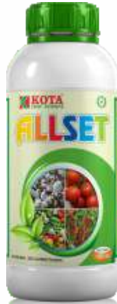
Pack Size 1000ml, 500ml, 250ml

Allset is a naturally derived product with combination which helps to make the plant healthy and vigorous and increase the strength against Various sucking pests, thrips & mites in field and horticultural crops.