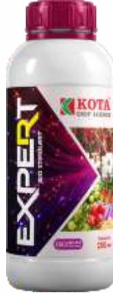
Pack Size 250ml

पीक : मिरची, कापूस, टोमॅटो, हरभरा, भुईमूग, भात, इतर भाजीपाला, शेत आणि बागायती पिके.