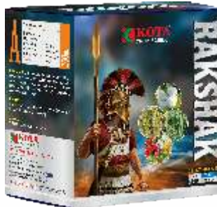
Pack Size 250ml + 250gm

पिके : मिरची, कापूस, भात, हरभरा, भुईमूग, कडधान्ये, टोमॅटो आणि इतर पिके.