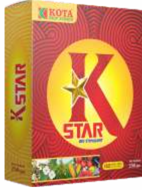
Pack Size 250gm

वापर कसा करावा : आवश्यक प्रमाणात पुरेसे पाण्यात मिसळा आणि पानांच्या दोन्ही बाजूंना / संसर्ग झालेल्या भागात फवारणी करा.