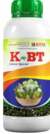
Pack Size 1000ml, 500ml, 250ml,

डोस: 2.0 ते 2.5 मिली प्रति एक लिटर पाणी / 250 मिली प्रति एकर.