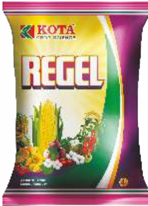
Pack Size 4kg

पिके : भात, ऊस, मका, भाजीपाला आणि बागायती पिके.