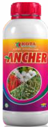
Pack Size 1000ml, 500ml, 250ml, 100ml

शिफारस केलेली पिके : मका, मिरची, कापूस, टोमॅटो, हरभरा, लाल हरभरा, भुईमूग, भात, इतर भाजीपाला, साधारण आणि बागायती पिके.