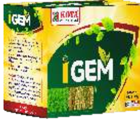
Pack Size 100gm+100gm

I-GEM is a naturally derived plant extract. Which act as a Bio Stimulant which enhances plant growth and boost up the crop health.