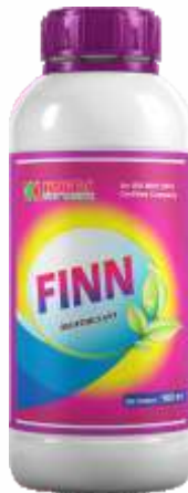
Pack Size 1000ml, 500ml, 250ml

वापरसाठी सूचना : वापरण्यापूर्वी चांगले हलवा आणि सुरुवातीला थोड्या पाण्यात विरघळवा, नंतर प्रभावी परिणामांसाठी पुरेसे पाणी मिसळून पिकावर फवारणी करा.