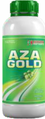
Pack Size 1000ml, 500ml, 250ml,

पिक: कापूस, मिरची आणि सर्व भाजीपाला पिके.