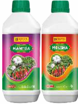
Pack Size 1000ml, 500ml, 250ml

Mantra & Moksha is a unique adjuvant spray Based on premium quality surfactant, Eugenol Derived from clove oil and aversive agents. The unpleasant taste by the spray works as an aversive agent.