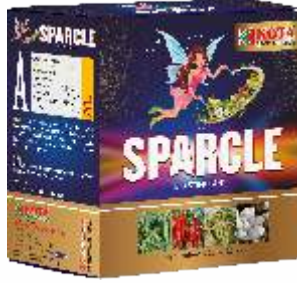
Pack Size 250ml+250gm

पिके: मिरची, कापूस, भात, हरभरा, भुईमूग, कडधान्ये, टोमॅटो आणि इतर पिके.