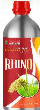
Pack Size 1000ml, 500ml, 250ml

Crop : Chillies, Cotton, Tomato, Bengal Gram, Groundnut, Paddy, other Vegetables, Field & Horticultural Crops.