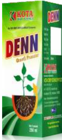
Pack Size 250ml

डोस: 2.0 ते 2.5 मिली प्रति एक लिटर पाणी / 250 मिली प्रति 1 एकर