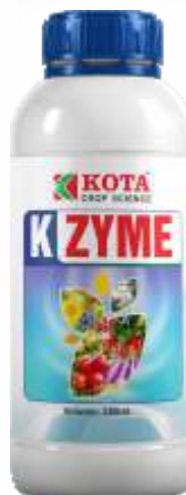
Pack Size 1000ml, 500ml, 250ml,

डोस: 2.0 ते 2.5 मिली प्रति 1 लिटर पाणी @ 250 मिली प्रति 1 एकर