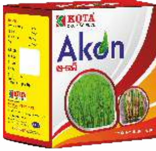
Pack Size 60gm + 60gm

डोस : एक एकरासाठी 60 ग्रॅम एकॉन आणि 60 ग्रॅम ऍडिटीव्ह बॉक्सच्या आत 150 लिटर पाण्यात मिसळा. फवारणी करताना काळजी घ्या कारण चांगले परिणाम मिळविण्यासाठी फवारणीचे द्रावण हॉपरच्या आक्रमणाच्या क्षेत्राला स्पर्श करेल.