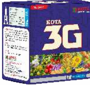
Pack Size 100ml + 100ml + 100gm

पिके : मिरची, कापूस, भात, हरभरा, भुईमूग, कडधान्ये, टोमॅटो आणि इतर पिके.