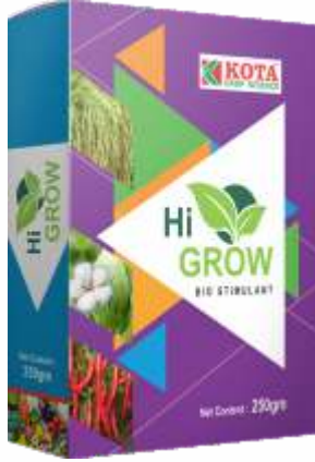
Pack Size 250 gm

Hi Grow is a Eco Friendly, Naturally Derived Organic product for all crops.