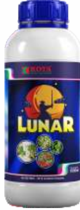
Pack Size 1000ml, 500ml, 250ml

पीक : मका, मिरची, कापूस, टोमॅटो, हरभरा, लाल हरभरा, हरभरा, पीक, भाजीपाला, साधारण आणि बागायती पिके.