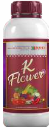
Pack Size 1000ml, 500ml, 250ml,

शिफारस केलेली पिके : मिरची, कापूस, टोमॅटो, भेंडी, वांगी, कडधान्ये, हरभरा, भुईमूग, फळे, पिके आणि इतर पिके.