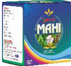
Pack Size 125gm

Mahi is a progressive organic powder a of which will enhance nutrition ability of plant and helps to develop the Strength against lepidopteran larvae in the Crops.