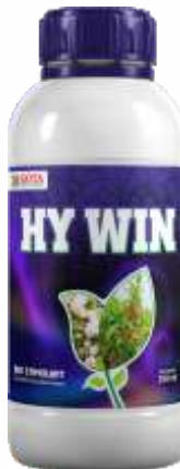
Pack Size 1000ml, 500ml, 250ml

पीक : मिरची, कापूस, भात, बेंगळुरू, भुईमूग, कडधान्ये, टोमॅटो आणि इतर पिके.