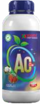
Pack Size 1000ml, 500ml, 250ml

पिक : मिरची, कापूस, टोमॅटो, हरभरा, भुईमूग, भात, इतर भाजीपाला, शेत आणि बागायती पिके.