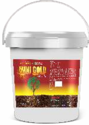
Pack Size 20kg, 10kg, 5kg

पिके : भात, मिरची, टोमॅटो, वांगी, कापूस, कडधान्ये, द्राक्षे, लिंबू, संत्री, खरबूज आणि इतर भाजीपाला व बागायती पिके.