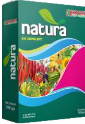
Pack Size 500gm, 250gm

शिफारस केलेली पिके : भात, कापूस, मिरची, टोमॅटो, भेंडी, वांगी, फळे आणि इतर भाजीपाला.