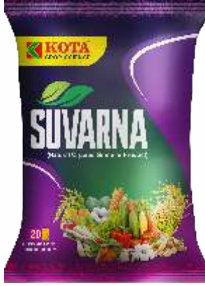
Pack Size 20kg

पिके: भात, मका, कापूस, मिरची, कडधान्ये आणि बागायती पिके