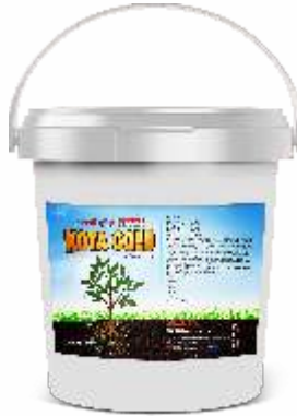
Pack Size 5kg, 10kg, 20kg

पिके: भात, मिरची, टोमॅटो, वांगी, कापूस, कडधान्ये, द्राक्षे, लिंबू, संत्री, खरबूज आणि इतर भाजीपाला व बागायती पिके.