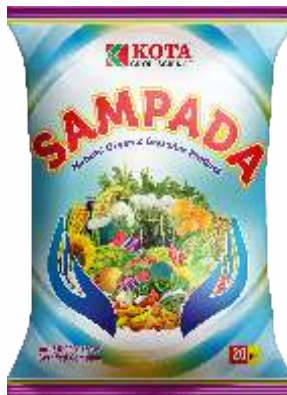
Pack Size 20kg

पिके : भात, मका, कापूस, मिरची, कडधान्ये आणि बागायती पिके.