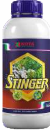
Pack Size 1000ml, 500ml, 250ml,

पीक : मका, मिरची, कापूस, टोमॅटो, हरभरा, लाल हरभरा, हरभरा, पीक, भाजीपाला, शेत आणि बागायती पिके.