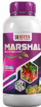
Pack Size 1000ml, 500ml, 250ml

पीक : मिरची, कापूस, टोमॅटो, हरभरा, भुईमूग, भात, इतर भाजीपाला, शेत आणि बागायती पिके.