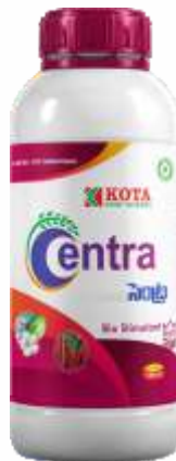
Pack Size 1000ml, 500ml, 250ml

शिफारस केलेली पिके : कापूस, मिरची, टोमॅटो आणि इतर बागायती पिके.