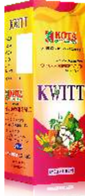
Pack Size 100ml+100gm

शिफारस केलेली पिके : मिरची, कापूस, भात, हरभरा, भुईमूग, कडधान्ये, टोमॅटो आणि इतर पिके.